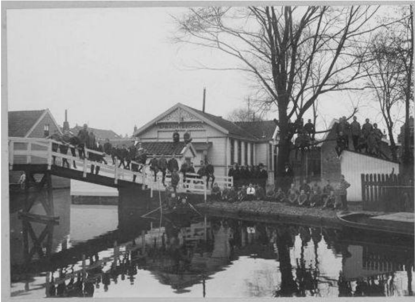
De Eerste Ambachtsschool.

Leerlingen van de ambachtsschool voor het gebouw aan het eind van de Herengracht aan de Vaart. De naam is nog te lezen.