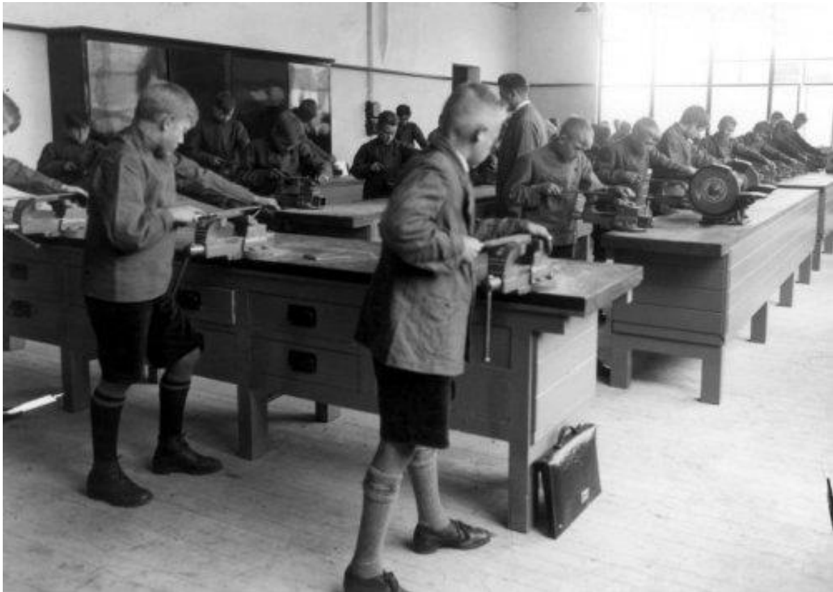
Zo, eerst maar eens leren veilen