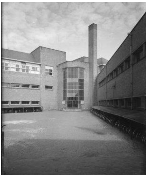
De binnenplaats met de rijwielstallingen

In gemeenteraad van 28 augustus is hier nog enige discussie over. Het blijkt dat ook de inspectie voor plaatsing bij de Ambachtsschool is. B&W voeren aan dat het organisatorisch beter past bij het Nijverheidsonderwijs en vanwege het eerdere argument dat het een theoretische opleiding is. Stemming 10 tegen 9 voor de Nijverheidsschool. De minister was het daar niet mee eens, maar de gemeente hield voet bij stuk. Pas in 1945 kon de Ambachtsschool de cursus aanbieden aan haar scholieren.