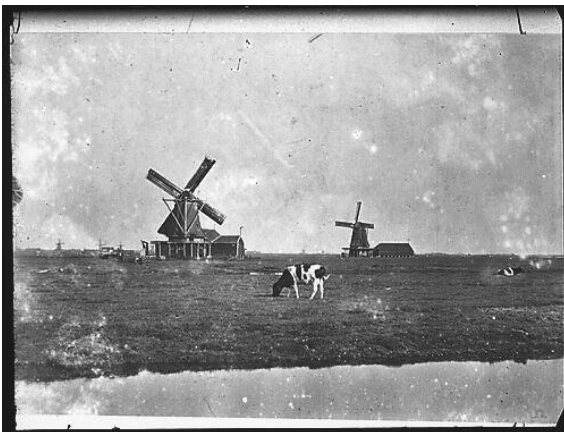
Dit is het Oostzijderveld met links molen de Woudaap en rechts molen het Honingvat, 1915. De laatste molen stond ter hoogte van de Brusselsestraat.

De molen de Rosmolen waar de buurt uiteindelijk haar naam aan ontleend, stond aan de overkant van de Gouw op 100 meter van het Honingvat.