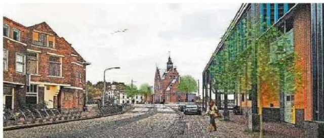
Een impressie van het havenkantoor.