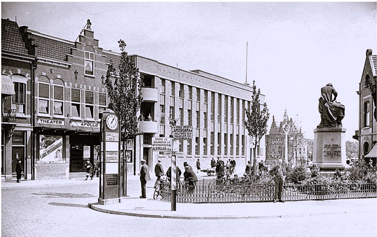
Het tweede postkantoor dat in 1930 in gebruik werd genomen is qua bouwstijl niet te vergelijken met zijn voorganger maar is wel een markant en stoer gebouw en heeft de status van gemeentelijk monument. Links van het postkantoor de originele gevel van het Apollo Theater. Het is doodzonde dat in later jaren besloten is deze pui een zgn. frisse look te geven hetgeen beslist geen verbetering was.