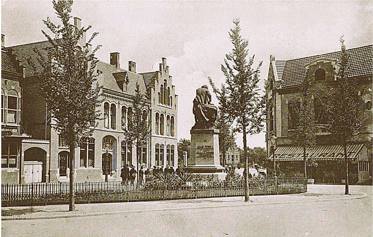
Het eerste postkantoor op de Dam, waarvan de bouw in 1914 begon. Beslist een fraai gebouw en ogenschijnlijk nog in prima staat, maar dat al direct na de ingebruikname ernstig verzakte. Het is gesloopt in 1925. Rechts naast het Czaar Petermonument is nog een fragment te zien van het Havenkantoor. De foto is van 1917.