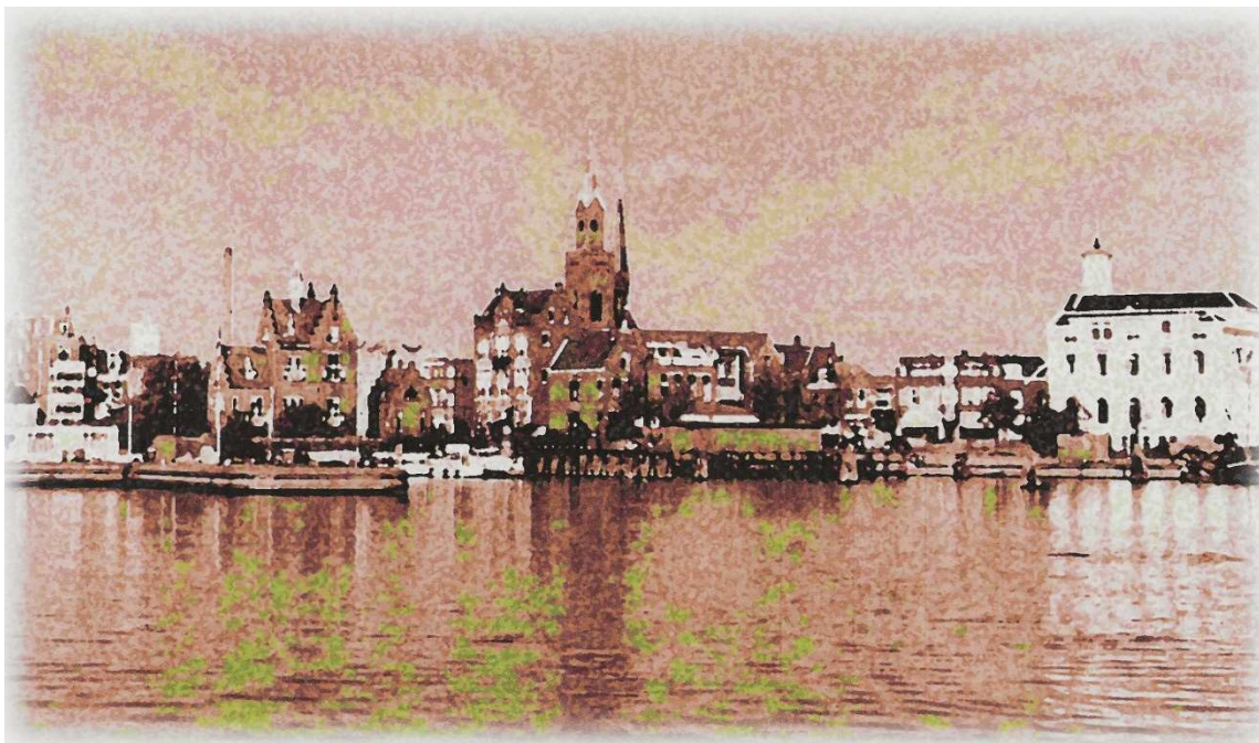
Een artistieke impressie van 'Zicht op Zaandam vanaf de Voorzaan'. (Opgestuurd door een Nieuwsbrieflezer).

Aan het eind van de 19 de eeuw kwam in Nederland de monumentenzorg van de grond die zich echter aanvankelijk richtte op het behoud van gebouwen uit de periode van vóór 1850. Vanaf plm. 1970 drong het besef door dat gebouwen van ná 1850 ook van monumentale waarde kunnen zijn. Omdat er geen landelijk overzicht was van belangwekkende gebouwen uit de tweede helft van de 19 de eeuw en de eerste helft van de 20 e eeuw ging in 1988 het Monument Inventarisatie Project (MIP) van start. Ook in de Zaanstreek vond deze inventarisatie plaats, hetgeen leidde tot een imposante lijst van fabrieksgebouwen, villa's, arbeidershuizen, boerderijen etc. Een willekeurige, kleine greep uit deze inventarisatie met er achter de bouwjaren: arbeiderswoningen Zaanse Talmabuurt (1919-1920), R.K. kerk aan de Marktstraat in Wormerveer (1915), Villa Vaartkade 10 te Zaandam (1910), Dam 10, voormalig winkelpand Zaandam (1911), Winkelgalerij A.F. de Savorin Lohmanstraat Zaandam (1930), Badhuislaan 2, Krommenie (1921), Oostkade 26-32, voormalig kantoor Zaandam (1915). Een aantal panden haalden die lijst niet omdat ze al weg waren, zoals bijvoorbeeld het Havenkantoor en het Ons Huis op de Gedempte Gracht. We kunnen er echter van overtuigd zijn dat deze beide iconische panden op de lijst zouden zijn geplaatst.