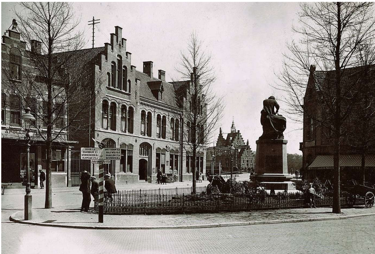
Foto uit plm., 1918 van de Dam met het eerste postkantoor dat op deze plek werd gebouwd. Een zeer fraai gebouw dat er ogenschijnlijk nog prima uitzag maar dat toen al ernstige problemen vertoonde wegens de slechte gesteldheid van de ondergrond en de zwakke fundering. Enkele jaren later moest het pand gesloopt worden.

Het is vreemd dat Woudt met geen woord repte over het Damschandaal, de onoordeelkundige wijze waarop het dempen van de havenkom en het heiwerk daarna geschiedde. De gevolgen waren desastreus; enkele eerste gebouwen die na het dempen op het Damplein gebouwd werden zoals het postkantoor, winkels en een restaurant begonnen al snel te verzakken en moesten na enkele jaren worden afgebroken. Het Havenkantoor, het eerste gebouw (1911-'12) dat in deze omgeving werd gebouwd, bleef gespaard van die ellende. Ruim zestig jaar hield het stand en moest, hoewel nog in puike staat, uiteindelijk toch wijken, niet wegens bouwvalligheid, maar vanwege de aanleg van de nieuwe Wilhelminaburg en de bouw van het Zaangemaal.